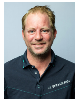
Bente Vallinga Public Relations